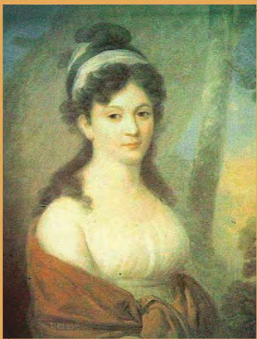
Екатерина Львовна Тютчева . Неизвестный художник. Конец XVIII– начало XIX в.