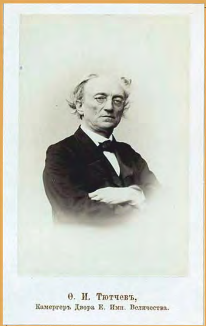
Ф. И. Тютчевъ, Камергеръ Двора Е. Имп. Величества.

Федор Тютчев. 1864 г.