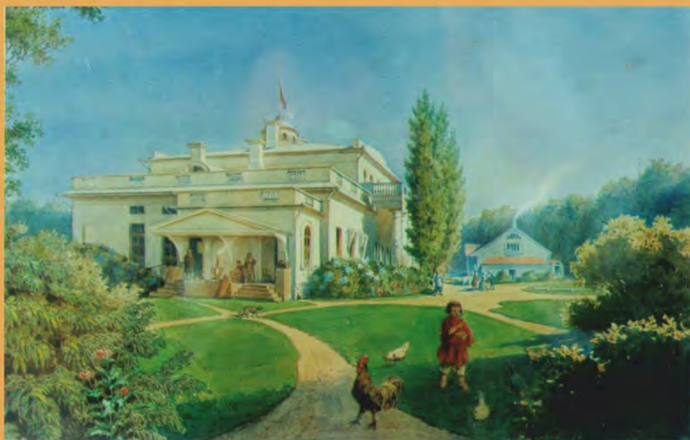
Общий вид усадьбы Тютчевых. Художник О. Петерсон. 1861 г.