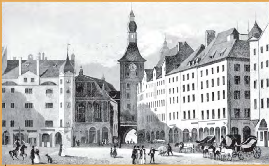
Городская ратуша в Мюнхене. Гравюра К. Герстнера по рисунку Й. Хоффмейстера. 1840 г.