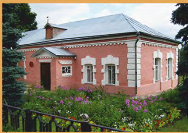
Краеведческий музей села Овстуг. Фотография. 1990-е гг..