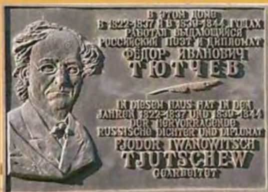
Мемориальная доска на здании первой русской миссии при Баварском королевстве. Здание находилось в Старом городе на Герцогшпитальштрассе 12

К концу 1829 г. Тютчев уже занимал довольно заметное место в мюнхенском обществе. Блестящий ум, широкое образование, самостоятельность, искрящееся остроумие и необыкновенное личное обаяние, которое отмечали все, кто был с ним знаком, делали Тютчева желанным гостем в светских салонах и не менее желанным собеседником в кругу университетских профессоров. Благодаря дружбе Федора Тютчева с Генрихом Гейне, Россия узнала о творчестве немецкого поэта, а Гейне-о сущности России.