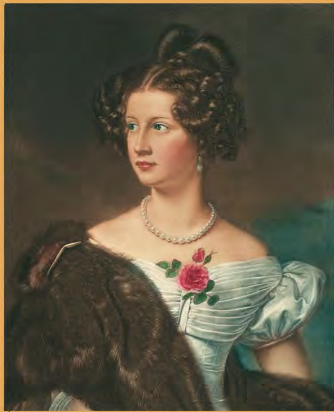
Амалия Адлерберг. Художник А. Цебенс. 1865 г.