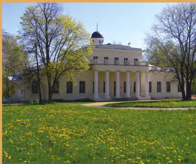
Дом-музей Ф.И. Тютчева в Овстуге. Фотография. 1990-е гг.

Овстуг становится яркой туристической достопримечательностью Брянщины. Музей-заповедник ежегодно принимает до 180 тысяч посетителей со всех уголков России, из ближнего и дальнего зарубежья.