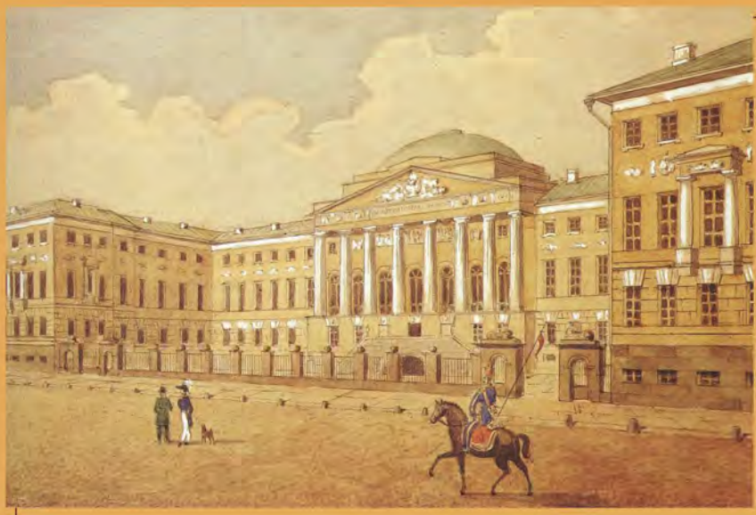
Московский университет. Художник Д. Жиларди. 1820 г.

В 1819-1821 годах Фёдор Тютчев учился в Московском университете. С 1816 года посещал лекции поэта и переводчика А.Ф. Мерзлякова как вольнослушатель, а в ноябре 1819 года был зачислен на словесное отделение как студент и окончил его в 1821 году. Среди преподавателей Тютчева были известные в то время профессора: археологии и теории изящных искусств - Михаил Трофимович Каченовский, красноречия и поэзии — Алексей Федорович Мерзляков. Уже после успешного окончания университета, весной 1822 года, Ф.И. Тютчев был зачислен на службу в Коллегию иностранных дел.