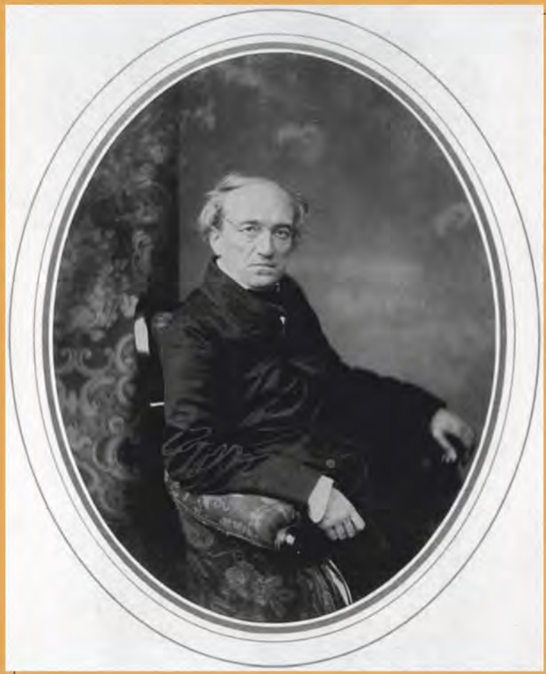
Федор Тютчев. Фотография С.Л. Левицкого. 1856 г.