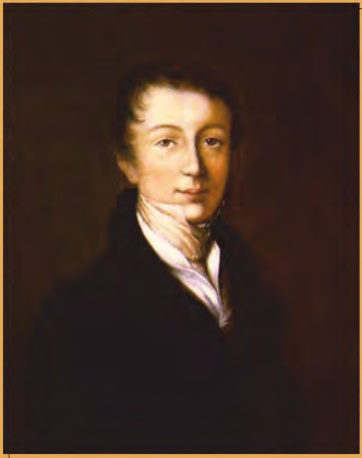
Федор Тютчев. Неизвестный художник. Конец 1810-х гг.

Обучаясь в Московском университете, Ф.И. Тютчев посещал лекции по теории изящных искусств и красноречия, статистики, археологии, всеобщей истории, словесности, политической экономии, естественному и гражданскому праву, изучал французский и английский языки. В то же время Тютчев занимался и самообразованием, посвящая много свободного времени чтению книг российских и европейских писателей и философов. В студенческие годы зародилась дружба Тютчева и Михаила Петровича Погодина, который стал впоследствии известным историком и профессором Московского университета.