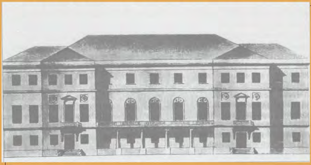
Дом Тютчевых. Рисунок М. Ф. Казакова. Около 1801 г.

С конца XVIII века домом в Армянском переулке владела жена капитана 2-го ранга князя Ивана Сергеевича Гагарина. С этого времени началась перестройка старого строения, для которой был привлечен хорошо известный в Москве талантливый архитектор Матвей Казаков. Двадцать лет особняк в Армянском принадлежал Гагариным. Но вот 22 декабря 1810 года дом был продан семье Тютчевых.