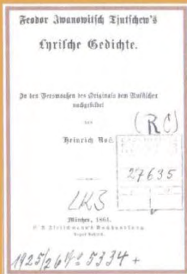
Титульный лист первого сборника стихотворений Ф.И. Тютчева на немецком языке. Переводчик Генрих Ноз.

Самый современный переводчик Тютчева на немецкий язык Л. Мюллер. Он почти полвека переводил Тютчева и собрал под одной обложкой как переводы Тютчева из немецкой поэзии, так и переводы стихотворений Тютчева на немецкий язык.