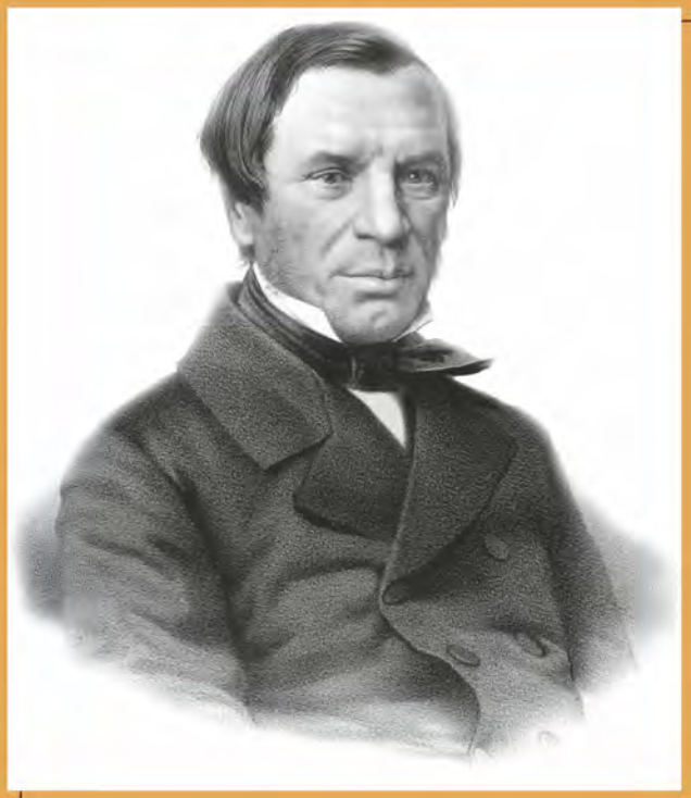
Михаил Петрович Погодин. Гравюра Ф. Бореля. 1860-е гг.

«Молоденький мальчик с румянцем во всю щеку, в зелененьком сюртучке, лежит он, облокотясь на диване и читает книгу».