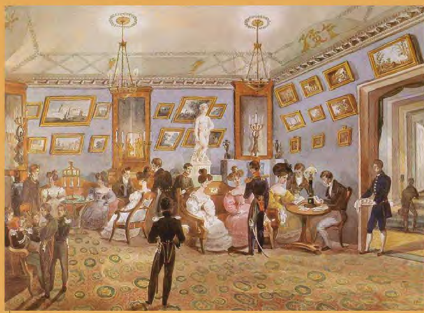
Великосветский салон. Неизвестный художник. Первая половина XIX в.

Федор Тютчев. Фотография Г.И. Денъера. 1864 г.