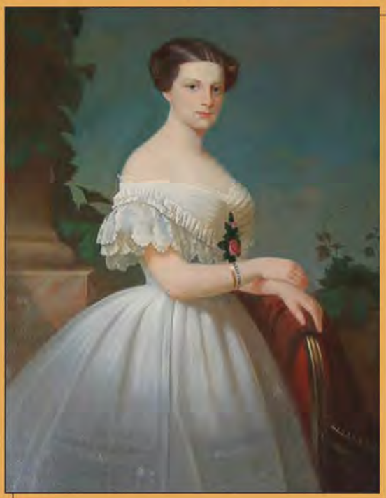
Амалия Крюденер. Художник И. Штилер. Начало 1830-х гг.