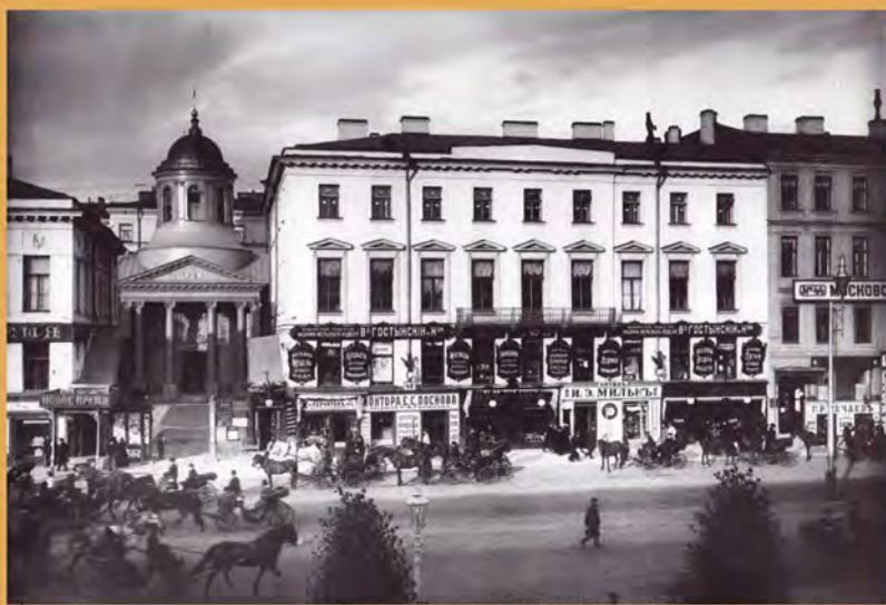
Дом №42 на Невском проспекте. Фотография. 1900-е гг.

Бывают роковые дни Лютейшего телесного недуга И страшных нравственных тревог; И жизнь над нами тяготеет И душит нас, как кошмар. Счастлив, кому в такие дни Пошлет всемилосердый бог Неоценимый, лучший дар — Сочувственную руку друга, Кого живая, теплая рука Коснется нас, хотя слегка, Оцепенение рассеет И сдвинет с нас ужасный кошмар И отвратит судеб удар, — Воскреснет жизнь, кровь заструится вновь, И верит сердце в правду и любовь.