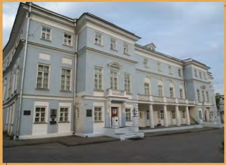
Дом Тютчевых. Фотография начала XXI в.

“Книга купчих на продажу дворов, дворовых земель и лавок”