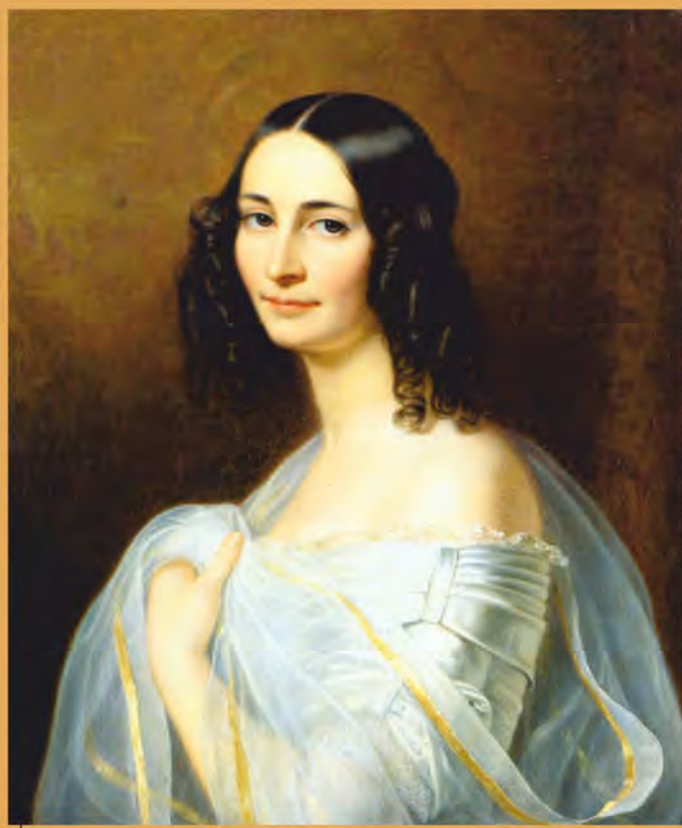
Эрнестина Тютчева Художник Ф. Дюрк. 1840 г.