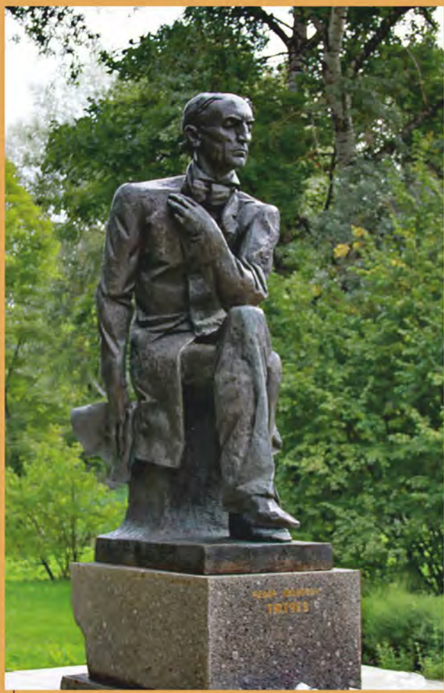
Памятник Ф.И. Тютчеву скульптора А.И. Кобилинца в Овстуге. Фотография. Начало 2000-х гг.