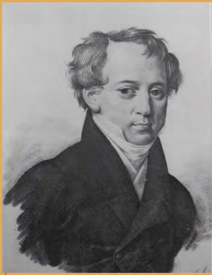
Фёдор Тютчев. Неизвестный художник. 1825 г.

13 мая 1822 года 18-летний Федор Тютчев, благодаря ходатайству графа А.И. Остермана-Толстого, был причислен «сверх штата» к российской дипломатической миссии в Мюнхене, столице Баварии. Здесь он служил с 1822 по 1837 год в российском дипломатическом представительстве при Баварском королевстве, позже – два года при Сардинском королевстве в Турине.