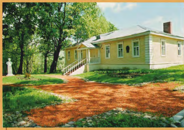
Школа М.Ф. Бирилевой. Фотография. 1990-е гг..