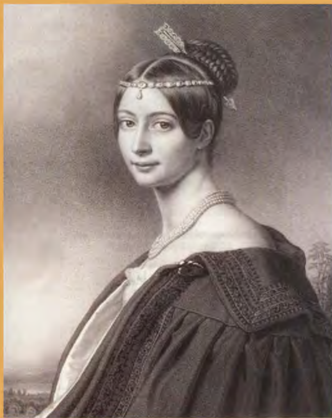
Эрнестина Тютчева. Художник Г. Бодмер. 1833 г. С оригинала Й. Штилера 1830 г.