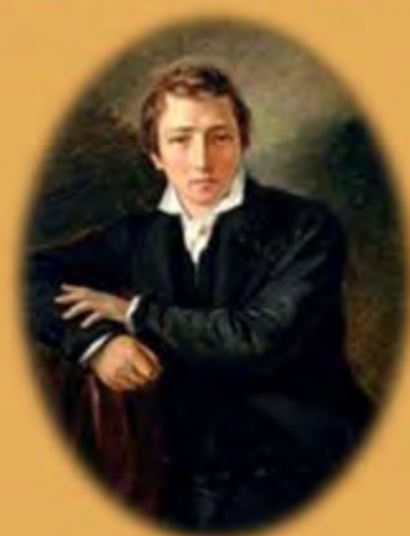
Христиан Иоганн Генрих Гейне (1797-1856)