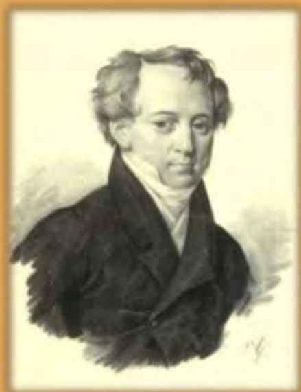
Федор Иванович Тютчев (1803-1873)